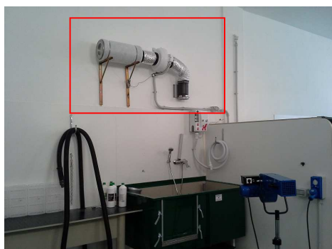
Tra cilindro interno e cilindro ext. granuli di carbone attivo